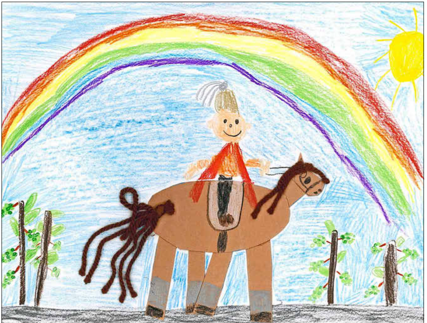
Siegerbild des Malwettbewerbs „60 Jahre Quirinusritt Perl“