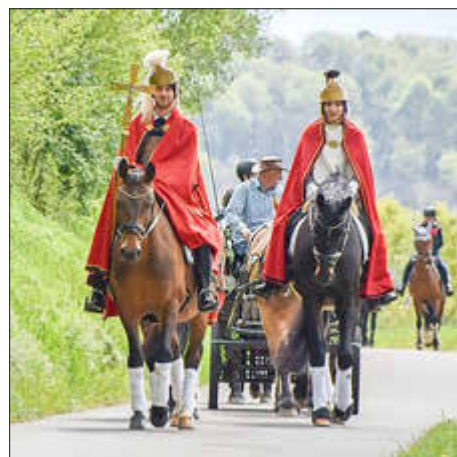
Feierlicher Quirinusritt in den Weinbergen

Zudem findet von Samstag, den 27. April bis Donnerstag, den 02. Mai 2024 am Katholischen Vereinshaus Perl, direkt oberhalb vom Park von Nell, die Perler Kirmes statt. Fünf Tage lang gibt es traditionelles Kirmesvergnügen mit Fahrgeschäften, Essens- und Getränkeständen unter freiem Himmel. Für die kleinen Gäste wird am Sonntag, 28.04.2024 Tom Teuer für die perfekte Unterhaltung im Vereinshaus Perl sorgen. Das Theater Tom Teuer zeigt mit „Ferdinand der Stier“ an diesem Mittag ab 14.00 Uhr die Geschichte eines Außenseiters, der ungewollt und ganz friedlich zum Helden wird. Der Eintritt ist kostenfrei. Ebenso können Kinder an dem Malwettbewerb „60 Jahre Quirinusritt Perl“ teilnehmen und mit kreativen Kunstwerken das traditionsreiche Fest darstellen.